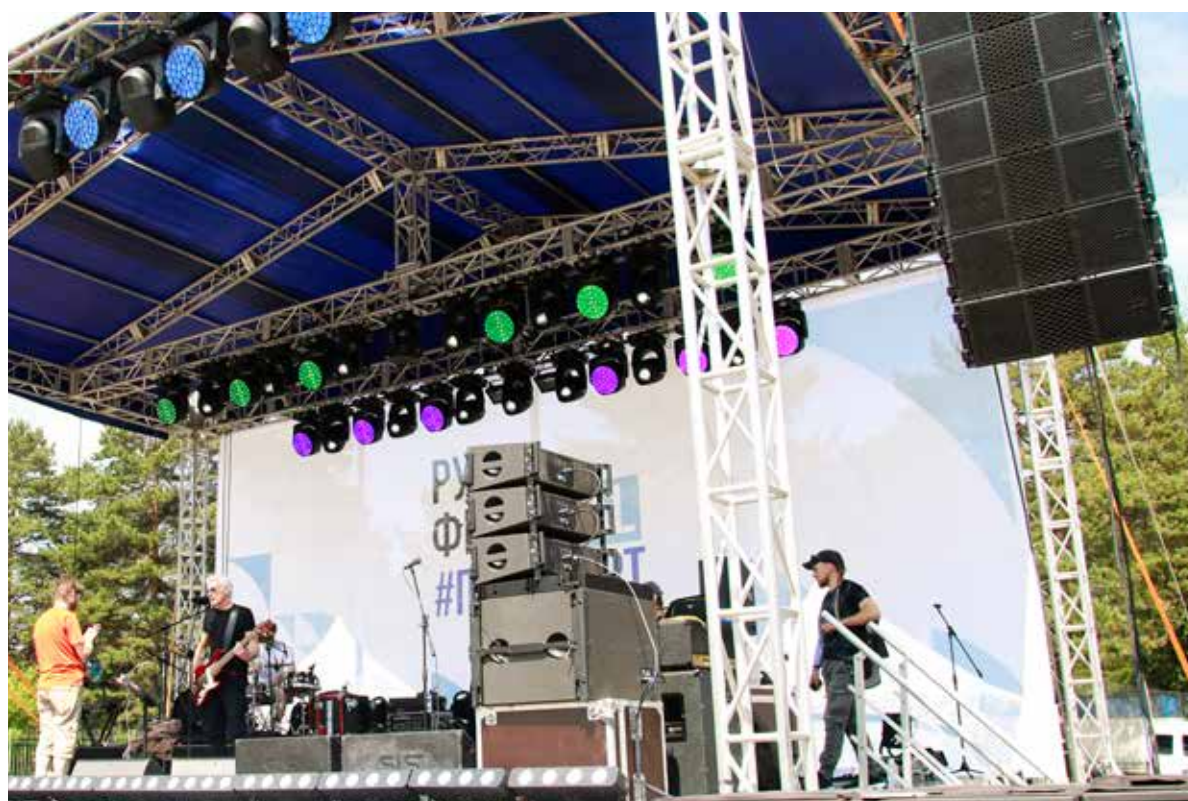
Концерт Александра Маршала