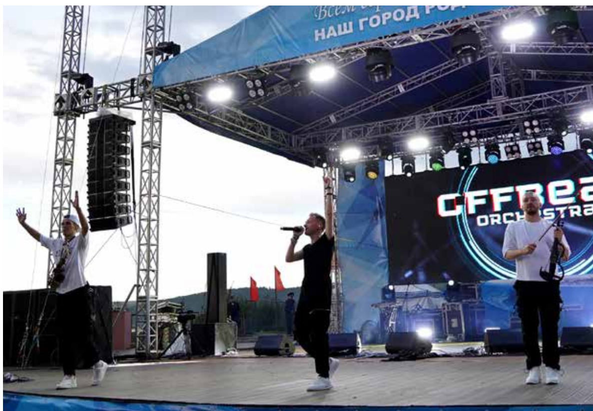
Концерт группы «Offbeat Orchestra»