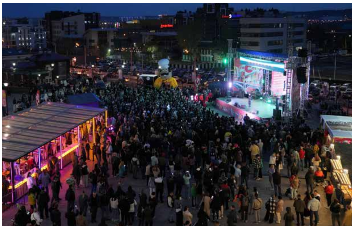
Концерт «МСМ - Музыка твоего города»