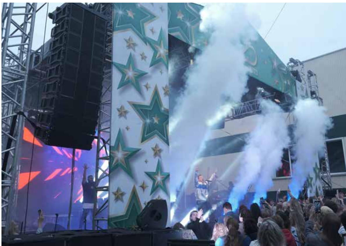
Концерт группы «Дискотека Авария»