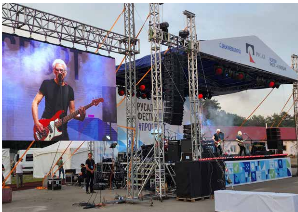
Концерт Александра Маршала