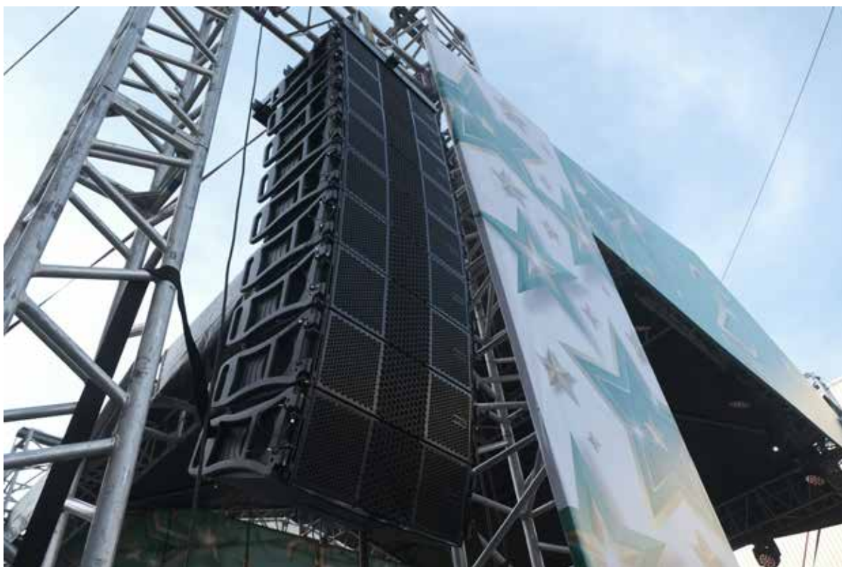
Концерт группы «Дискотека Авария»